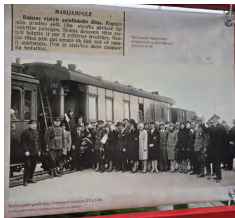
Parodos „Lietuvos geležinkelių perlas: Marijampolės geležinkelio stoties keleivių rūmams – 100“ fragmentas

Spalį – kūrybinės dirbtuvės vaikams „Miesto legendos“ bei edukacijos mokiniams suteiks galimybę jaunajai kartai iš arčiau susipažinti su šimtametės stoties istorija.