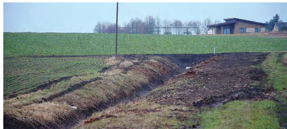
Atnaujintos sistemos pasitarnaus ir ūkininkams, ir gyventojams

Pernai pradėti Jevonio upelio tvarkymo darbai šiais metais taip pat pasitūmės į priekį. Projekto įgyvendinimą stabdė elektros kabelių perkėlimo klausimai jau išspręsti, todėl visi darbai toliau vykdomi pagal planą.