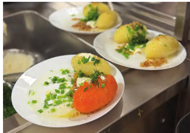
Meniu – įvairių rūšių, net oranžiniai cepelinai

MPRC bendruomenei šis renginys kasmet tampa ne tik puikia proga puoselėti lietuviškas tradicijas, bet ir stiprinti bendruomeniškumą bei socialinę atsakomybę. O smagiausia, kad kasmet vis daugiau žmonių prisideda dalyvaudami gerumo iniciatyvose, todėl viltingai tikimasi, jog ši tradicija tęsis ir ateityje.