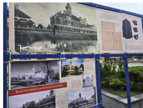
Parodos „Lietuvos geležinkelių perlas: Marijampolės geležinkelio stoties keleivių rūmams – 100“ fragmentas

giny su fotografijų paroda bei kelionės traukiniu iki Kazlų Rūdos leis išgirsti išpūdingas istorijas.