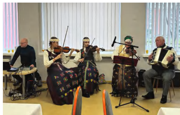
Gerą šventės nuotaiką kūrė ir muzikantai

taip prisidedant prie šventės sėkmės. O smagiausia, kad nieko nereikia skatinti. Iniciatyvą rodo pati bendruomenė.“