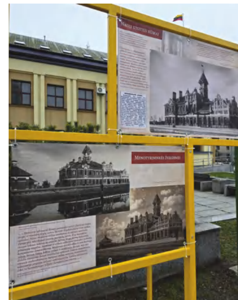
Parodos „Lietuvos geležinkelių perlas: Marijampolės geležinkelio stoties keleivių rūmams – 100“ fragmentas

Visi marijampoliečiai kviečiami tapti šios šventės dalimi – pasidalinti savo idėjomis, kaip dar būtų galima paminėti šį jubiliejų – galbūt turite minčių dėl renginių, meninių projektų ar kitų kūrybiškų būdų, kurie atspindėtų mūsų geležinkelio stoties svarbą?