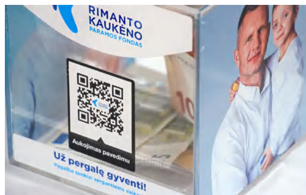
Kilniam tikslui šiemet suaukota rekordinė suma

MPRC direktorius džiaugiasi, kad trečius metus vykstantis renginys jau tapo neatsiejama įstaigos metų rato dalimi. „Pagrindinėje – gamybos – dalyje plūša virėjo profesijos mokinių ir mokytojų komandos, prisideda ir savanoriai. Kiti darbuojasi organizacinėje ir kultūrinėje renginio dalyje, kuriant šventinę nuotaiką, skiriant malonų dėmesį šventės dalyviams,