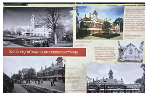
Parodos „Lietuvos geležinkelių perlas: Marijampolės geležinkelio stoties keleivių rūmams – 100“ fragmentas