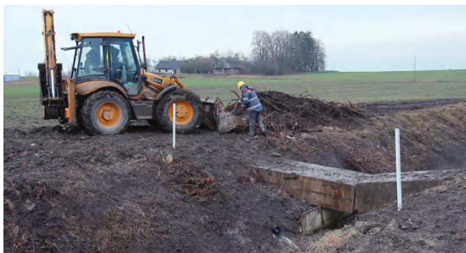
Mokolų kaime darbai jau įgavę pagreitį

Pastaraisiais metais Marijampolės savivaldybės taryba skiria didelį dėmesį melioracijos projektams: „Anksčiau galbūt šiek tiek ir lėšų pritrūkdavo, o dabar tikrai matome didesnę dėmesį. Taryba skiria vis didesnę finansavimą, todėl galima išplėsti darbų apimtį. Ši vieta, kur dabar stovime (Mokolų k. Lūginės g.), labai gerai iliustruoja darbų apimtį: štai vienoje pusėje – urbanizuota vietovė, kur yra pastatyti namai, kitapus melioracijos griovio matome ūkininkų dirbamus žemės plotus, o štai mums už nugaros – komercinės paskirties pastatai. Tai reiškia, kad visa ši sistema yra be galo reikalinga visiems. Tik mes to niekada nepastebime, nes tiesiog