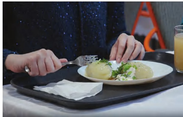
Lėkštės tuštėjo greitai – buvo neabejotinai skanu

O turint tikslą padėti, šventė visuomet pavyksta ne tik skani, bet ir prasminga. Šiemet cepelinų ragautojai visuose MPRC skyriuose suaukojo 4301 eurą (tai yra beveik dvigubai daugiau nei pernai). Pinigai skirti Rimanto Kaukėno paramos fondui, prisidedant prie pagalbos sunkiai sergantiems vaikams. „Tai buvo