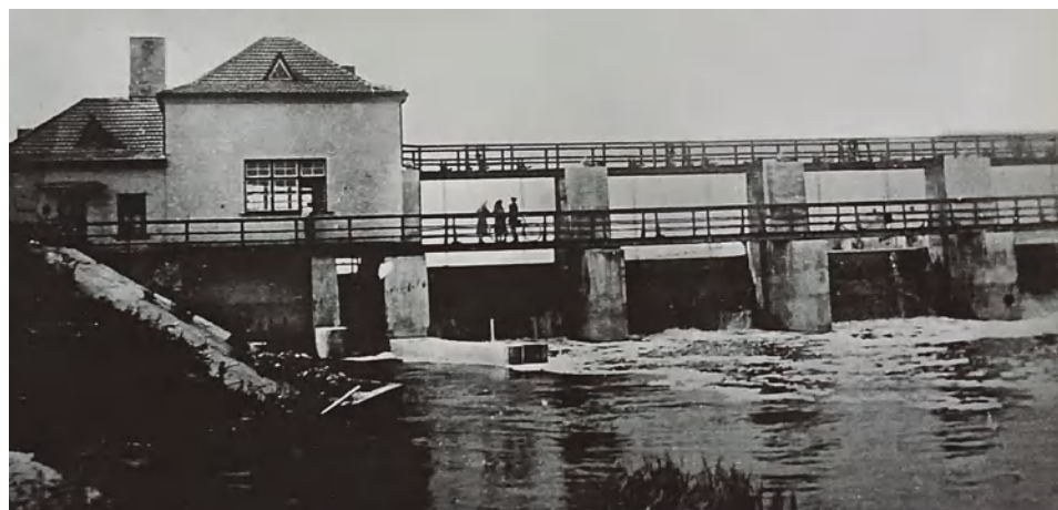
Marijampolės hidroelektrinė Antrojo pasaulinio karo metais

Iš pradžių šnekėjo, kad miesto hidroelektrinę statys prie Marijonų