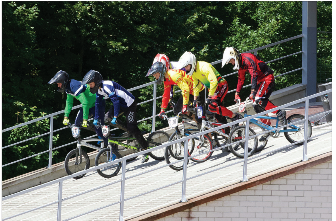
2019 metų Lietuvos BMX čempionatas Šiauliuose