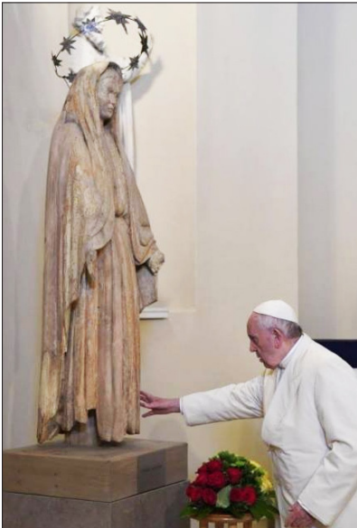
Popežius Pranciškus prie Sibiro Madonos

Knyga lietuvių ir anglų kalbomis, iliustruota puikiomis, iškalbingomis, skaudžiai praeitį bylojančiomis autoriaus nuotraukomis. Pagaliau nuimtas šydas nuo legendomis apipintos Švč. Mergelės Marijos skulptūros sukūrimo, išsaugojimo ir pargabenimo į Lietuvą istorijos. Prartarmėje Kardinolas Sigitas Tamkevičius rašo: „Žemai lenkiu galvą prieš tuos mūsų tautiečius, kurie daug laiko praleido Sibire, ieškodami ir tvarkydami tremtinių kapus, ir kurie išsaugojo bei pargabeno į Lietuvą Korbiko Madoną“.