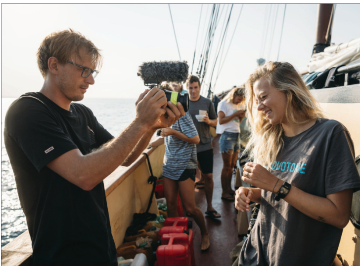
Kadras iš filmo „118 pėdų laisvės“

Visą festivalio programą rasite LTOK.lt . Filmus gruodžio 10-16 dienomis žiūrėkite kinofondas.lt . „Sporto kino festivalio“ Facebook platformoje vyks diskusijos apie filmus ir jų gvildinamą problematiką, nuotoliniu būdu bus bendraujama su režisieriais, filmų herojais, specialistais.