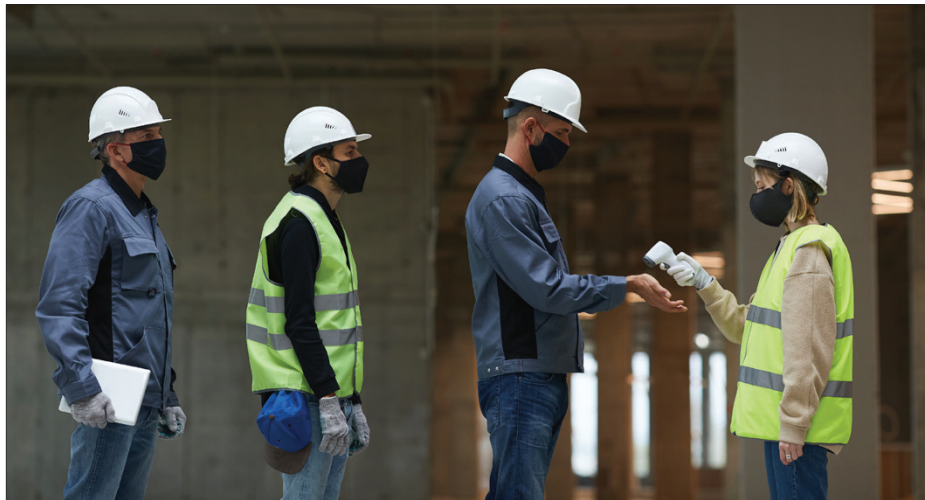
Covid-19 pandemijos akivaizdoje daugeliui įmonių tenka prisitaikyti prie naujų veiklos sąlygų

Šias priemones administruojančios įmonės „Investicijų ir verslo garantijos“ (INVEGA) duomenimis, iki lapkričio 29 dienos jau priimta beveik 15 tūkst. teigiamų sprendimų dėl finansavimo suteikimo. Labiausiai nuo Covid-19 nukentėjusiems verslams kartu su