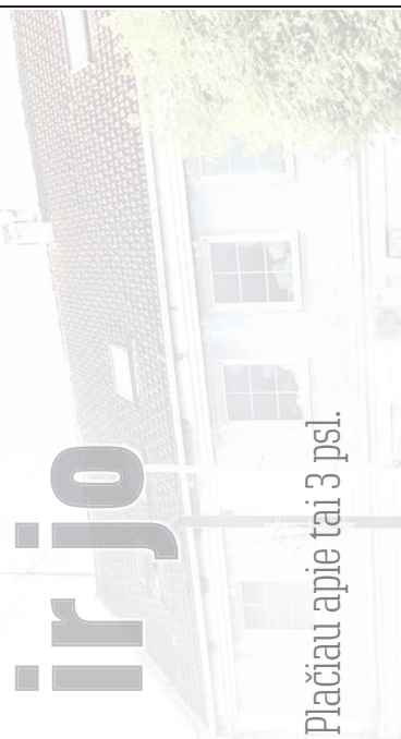
Plačiau apie tai 3 psl.