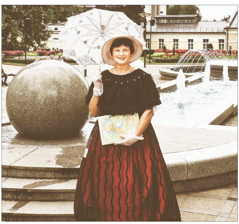
Gidė laukia Druskininkų svečių

Kviečiame visus į Druskininkus, įsitraukti į gurmanišką linksmybių sūkurį!